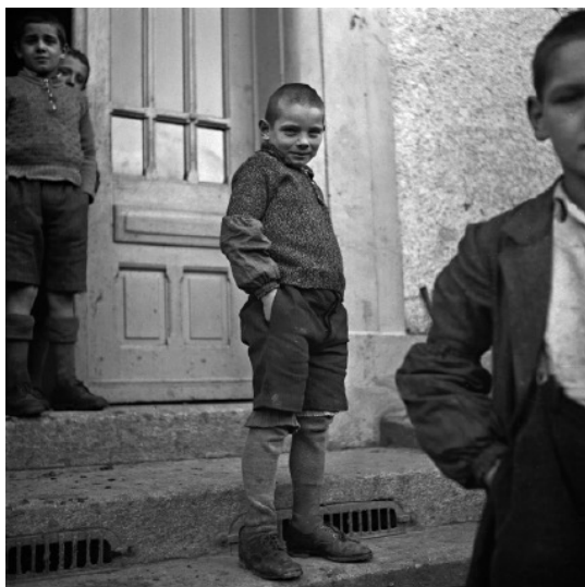
1944 Verdingkind, Ein Leben am Rand der Gesellschaft?

Hier findet ihr grundlegende Informationen zu einer spezifischen Geschichte der Ausgrenzung und des Wegsperrens in der Schweiz: in beispielsweise Erziehungs-, Arbeits- und Strafanstalten. Es geht um die Geschichte der fürsorgerischen Zwangsmassnahmen und Fremdplatzierungen, speziell auch um sogenannte administrative Verordnungen.