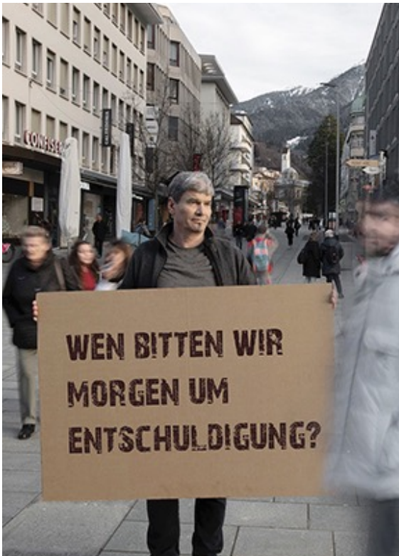
Plakate aus der Aufarbeitung im Kanton Graubünden.