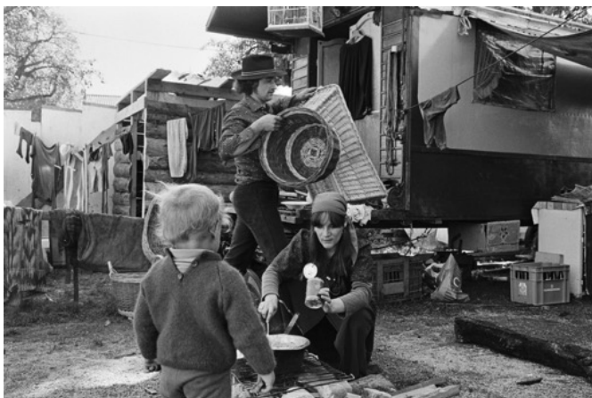
Andere Lebensformen passten nicht in die bürgerliche Normvorstellung.

Darunter verstehen wir Massnahmen von Behörden gegenüber Erwachsenen und Minderjährigen. Diese wurden bis 1981 mit kaum vorhandenen Verfahrensrechten und regionalen Unterschieden umgesetzt. Zu den Betroffenen zählen z.B. Verding-, Pflege- und Heimkinder, Jenische oder administrativ versorgte Personen.