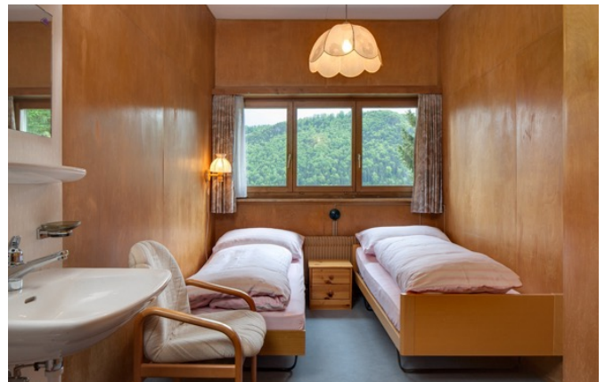
Das Leben in einem Kinder- oder Erziehungsheim bat wenig Platz für Individualität.

Auch wurden an Menschen Zwangssterilisationen und -kastrationen vorgenommen. Das heisst, bei ihnen wurden ohne Einwilligung Operationen durchgeführt, damit sie keine Kinder mehr zeugen konnten. Oder Kinder mussten unter Druck zur Adoption freigegeben werden. So konnte etwa ein Baby einer unverheirateten Mutter weggenommen werden oder Kinder wurden in Kinderheimen oder zu Pflegefamilien platziert, weil sich Eltern scheiden liessen. In der Schweiz wurden Kinder auch bei Bauernfamilien platziert, damit sie als kostenlose Arbeitskräfte eingesetzt werden konnten. Diese Kinder werden als Verdingkinder bezeichnet. Sie erlebten oftmals Gewalt und Erniedrigung und kaum emotionale Nähe. Ihre Familien sahen sie oft jahrelang nicht oder sogar nie wieder.