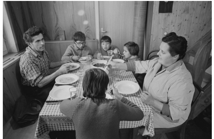
Was ist eine «normale» Familie? Das ZGB hat den Behörden die Grundlage für die Bewertung von Lebensformen geliefert.