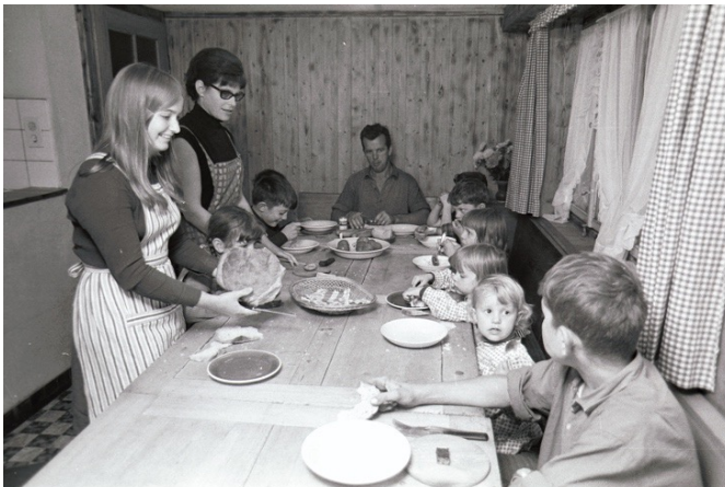
Sozialhelferin bei Familie in Bergdietikon

Kinder nicht verheirateter Eltern wurden zusätzlich diskriminiert, weil das ZGB eine automatische Beistandschaft bei der Geburt vorsah. Dies führte in den meisten Fällen zu einer Vormundschaft. Besonders ledige Mütter wurden Opfer solcher Eingriffe und wurden teilweise zur Weggabe ihrer Kinder gezwungen (Zwangsadoptionen).