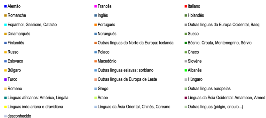
Figura 2. As línguas maternas presentes nas escolas da cidade de Biel/Bienne (Bista BE, 2018).

Talvez a maior cidade bilingue oficial na Suíça constitua um exemplo extremo, mas este ‘laboratório de línguas’ ilustra a transnacionalização progressiva que outros países europeus também conhecem, ou seja, a normalização da diversidade linguística em todo o mundo. O escritor Robert Walser refere-se a Biel/Bienne, sua cidade natal, do seguinte modo: "Na verdade, eu cresci numa cidade cosmopolita muito, muito pequena" 11 (Walser, 1985, p. 40).