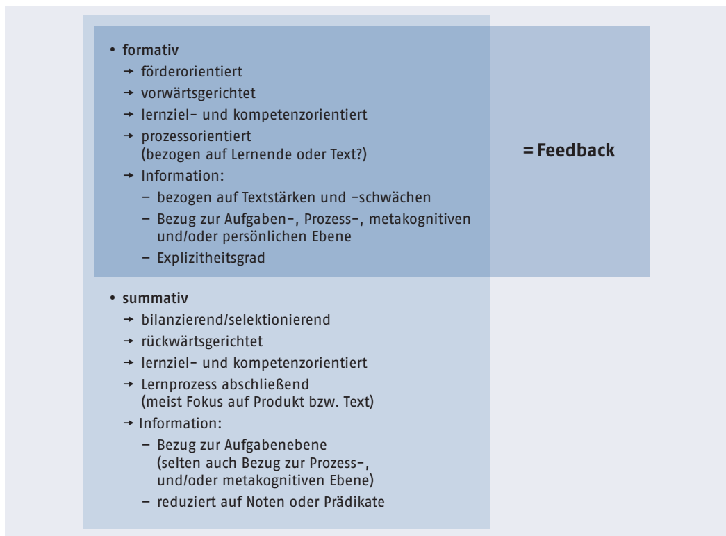
Abbildung 2 Funktion schriftlicher Textkommentierungen

Der Begriff „formativ“ wird im pädagogischen Kontext meist gleichbedeutend mit „förderorientiert“ verwendet (vgl. Smit 2009: 33) und in Zusammenhang mit den Konzepten Förder-, Prozess- und Kompetenzorientierung diskutiert (vgl. z. B. Smit 2009: 37 ff.; Sturm/Weder 2016: 158 ff.). Gemäß Sturm/Weder (2016: 159) bspw. steuert eine formative Rückmeldung Lernprozesse auf eine Kompetenz hin und ist damit vorwärtsgerichtet. Nach diesem Ansatz der Feedbackforschung geht es im Kern darum, „to reduce discrepancies between current understandings/performance and a desired goal“ (Hattie/Timperley 2007: 87). Aus diesem Blickwinkel müssen formative Rückmeldungen Informationen enthalten,